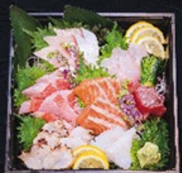
19 特選オードブル(3人前盛) + 刺身盛り合わせ 8,000円