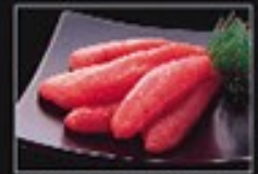
⑩ 極上つよ卵 大切れたら子 (アラスカ産)280g 1,300円