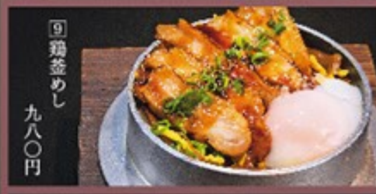
⑨ 鶏釜めし 九八〇円