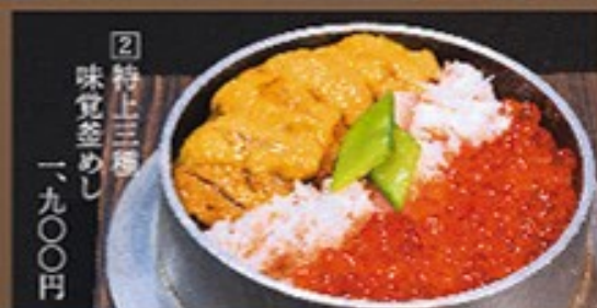
② 特上三種味覚釜めし 一、九〇〇円

新潟県が誇る、新巻漁業を流れる「鱈住海峽」。昔から好漁場として知られます。これらの地産を中心に、全国の新しい魚を市場で直接買い付けし、その魚に合った調理を心掛けてまいります。