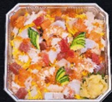
20 特選オードブル(3人前盛) + パラちらし 8,000円

※手前・人数はご相談ください。 ※刺身盛り合わせ・パラちらしの単品販売は行っておりません。