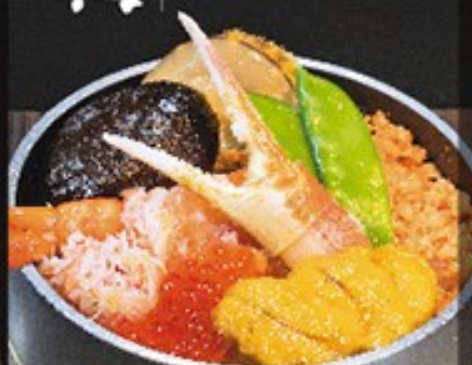
⑧ ばん屋五目釜めし 一、〇〇〇円