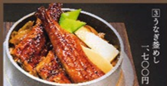
③ うなぎ釜めし 一、七〇〇円