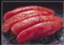
⑪ 極上つよ卵 大切れ辛子明太子 (アラスカ産)280g 1,300円