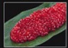
⑧ 極上紅鮭子 すじ子 (アラスカ産)230g 1,500円