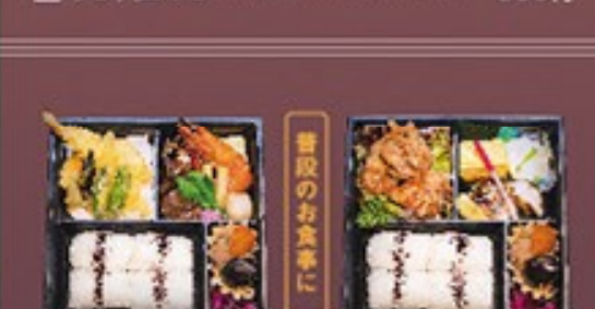
⑯ 華弁当 980円