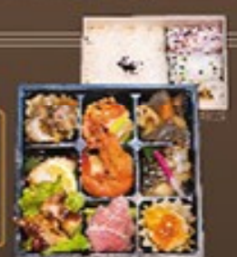
⑬ 旬彩松花堂弁当 1,880円