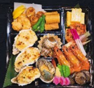
18 特選オードブル(3人前盛・早品) 6,000円