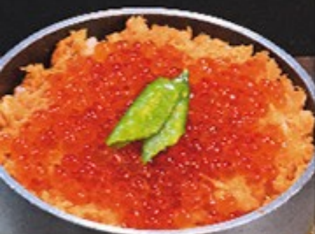
① いくらたつぷり釜めし 一、七五〇円