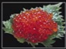
⑨ 特選ます子 醤油漬 (アラスカ産)190g 1,500円