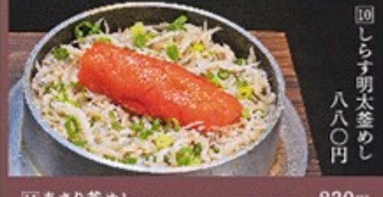
⑩ しらす明太釜めし 八八〇円