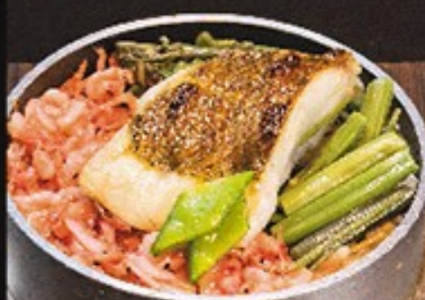
④ 焼き鯛釜めし 一、三八〇円