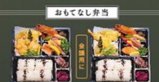
⑭ ばんや弁当 1,580円