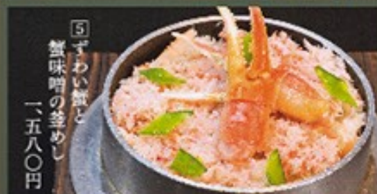
⑤ すわい蟹と蟹味噌の釜めし 一、五八〇円