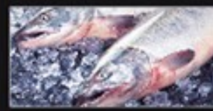
⑫ 三陸甘塩銀鮭 特厚切り身 150g 3切 1,200円

三条のお土産や街贈答に。 ⑬ ご飯のお供5品セット 5,800円⇒6,500円 ※上記21～25のセットとなります。