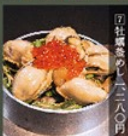
⑦ 牡蠣釜めし 一、二八〇円