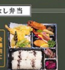
⑮ 幕ノ内弁当 1,200円