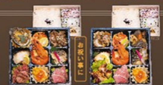
⑫ 極松花堂弁当 2,300円